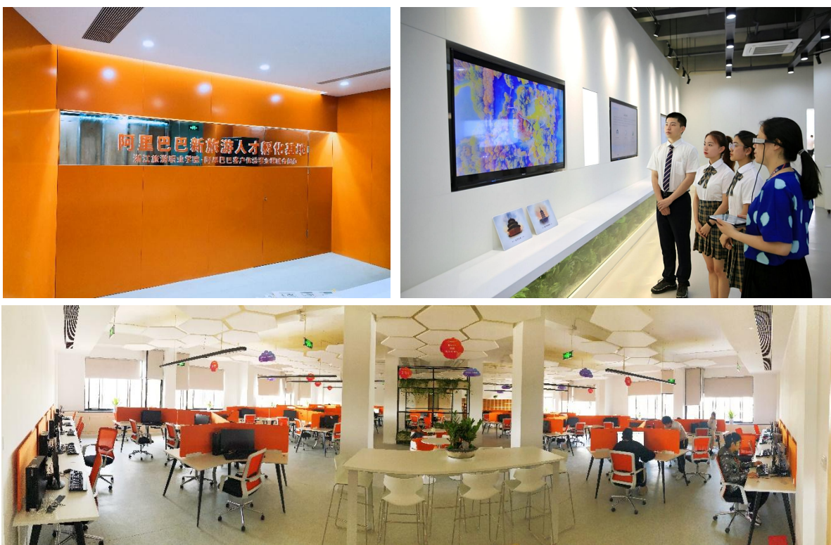
图5 产教融合、智慧技术融入的产业学院教学现场