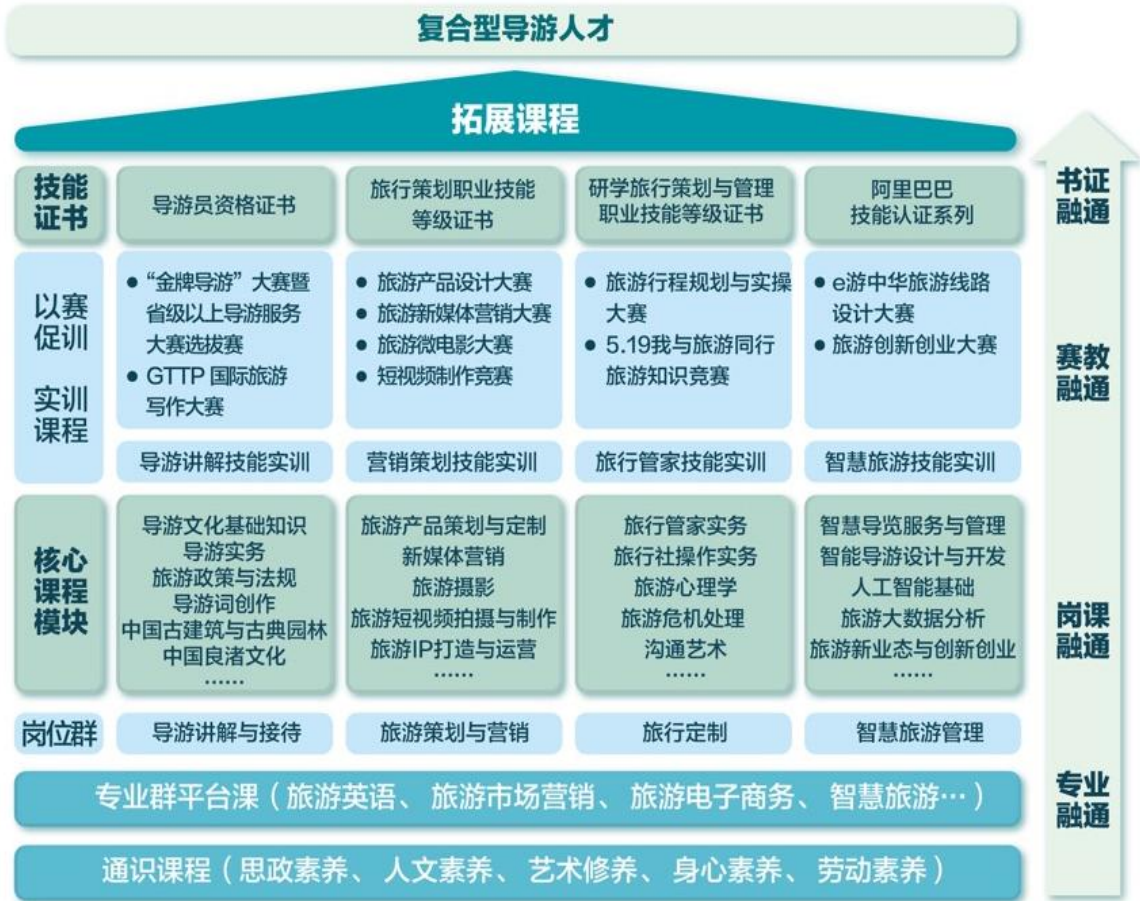
图2 “四维融通”课程体系

4. 赛教融通。“以赛促学、以赛促教”，设定每年的5-6月份为学生技能文化节，以至少10项专业群“课程赛事”对接核心课程教学，同时为省赛和国赛作准备，为创新创业作品的孵化作储备。